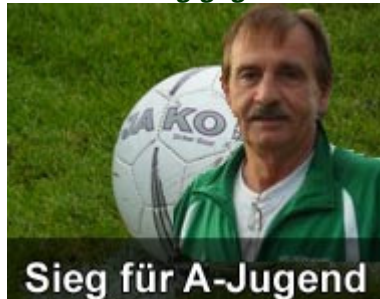
Sieg für A-Jugend

Nach der bitteren Niederlage in der letzten Woche gegen Post konnte unsere A-Jugend heute einen wichtigen 2:1 Sieg gegen die SG Herrieden erzielen.